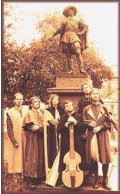
Via Sonora with Gustavus II Adolphus, the Swedish King under whom Academia Gustaviana was founded in 1632