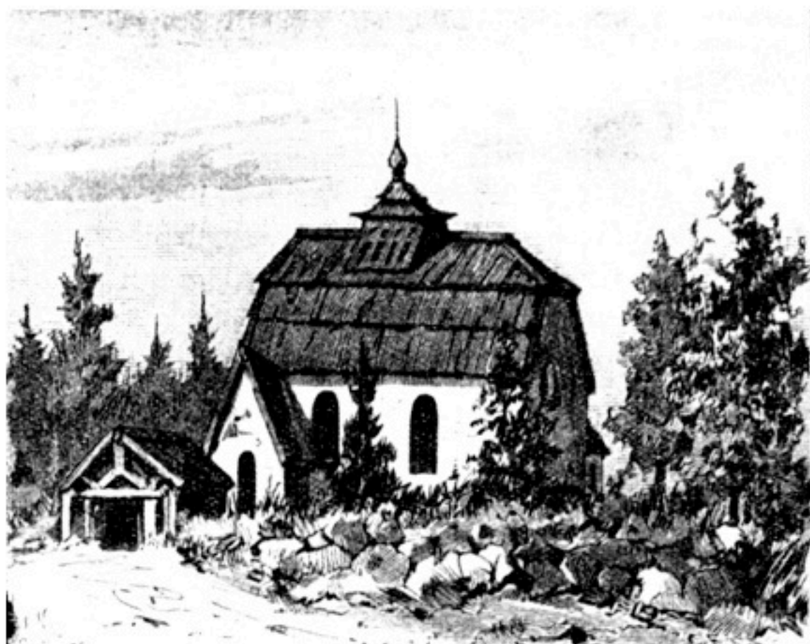
Ytterlännäs gamla kyrka.

Den 22 okt. 1854 hölls den sista ordinarie gudstjänsten i denna kyrka. Följande söndag invigdes församlingens nybyggda tempel. Tillfälligtvis hållas dock ännu gudstjänster någon gång i detta ärevördiga gamla Gudshus.