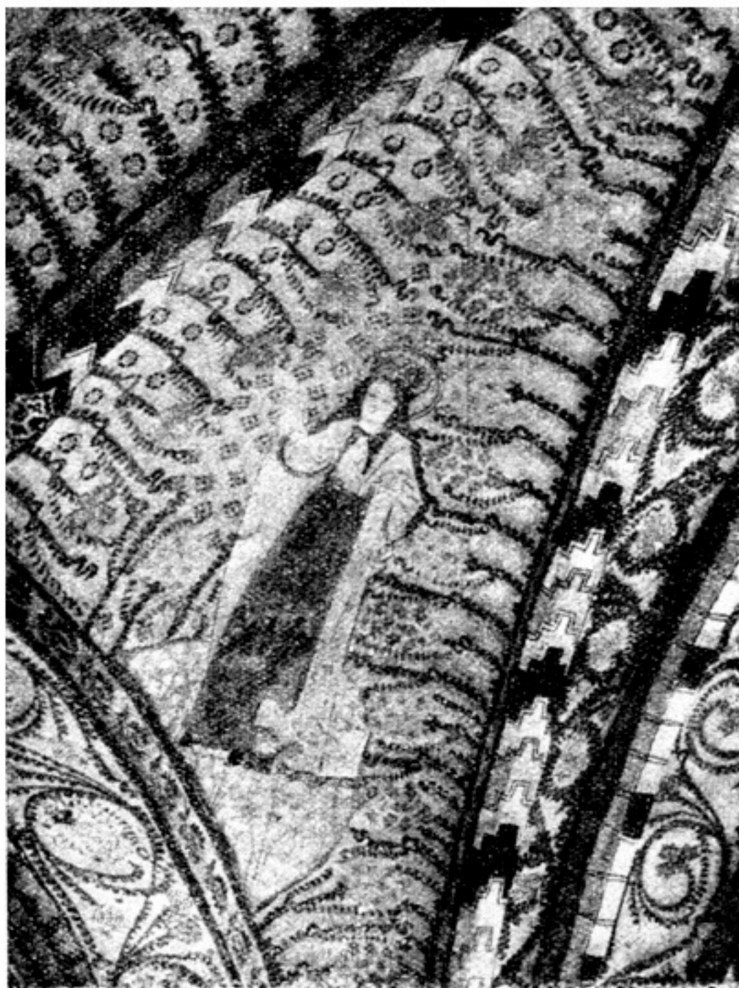
Valvmålning i Ytterlännäs gamla kyrka.

grönt. Vinrankor med druvklasar och schablonerade blad samt natemotiv fylla de fält, som ej ha figurmålningar. I nordöstra delen av korvalvet synas några