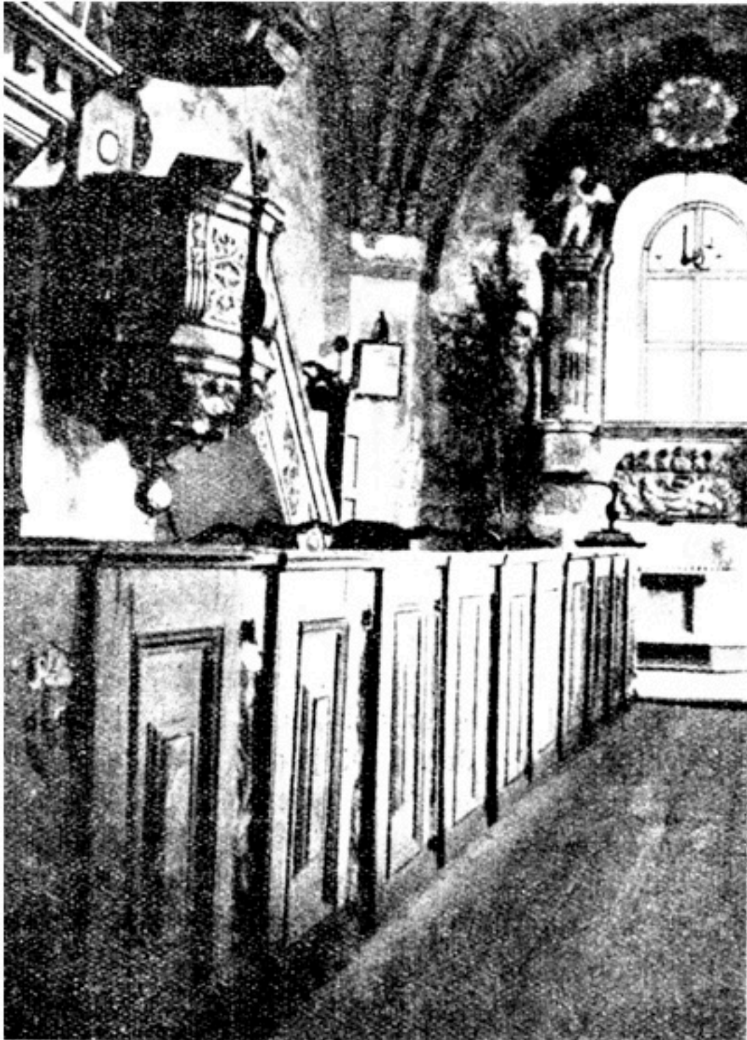
Ytterlänns gamla kyrka (mot predikstolen).

för målning på predikstolen och kyrkobänkarna samt läktaren efter överenskommelse i sockenstämma den 22 novembris och qvittance 1100 d:r kpm“.