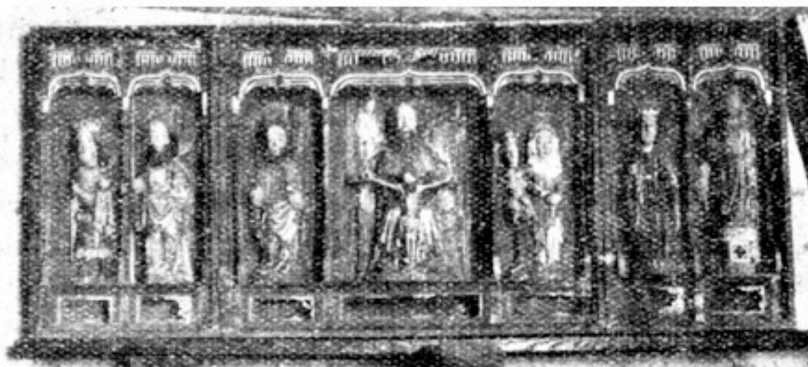
Altarskåp i Ytterlännäs gamla kyrka.

Till den återinvigning, som efter dessa genomgripande förändringar måhända ägde rum*) hade kyrkan också förvärvat ett större och vackrare altarskåp (f. n. placerat på nedre läktaren) och den stora madonnabild, vi nu se pryda norra väggen intill predikstolen.